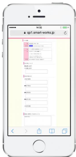
これまでの回答ページ