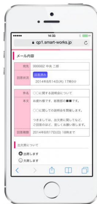
最適化された回答ページ