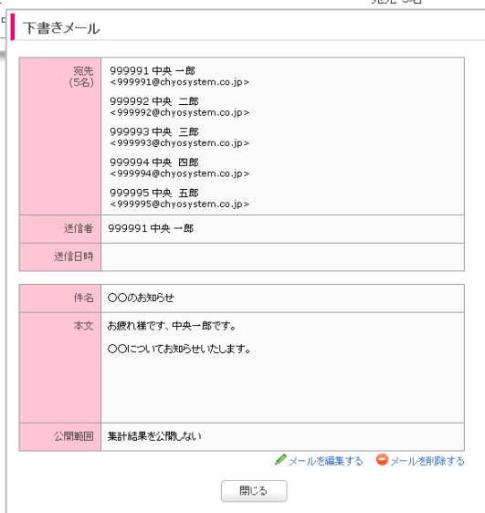
(下書きメール一覧)