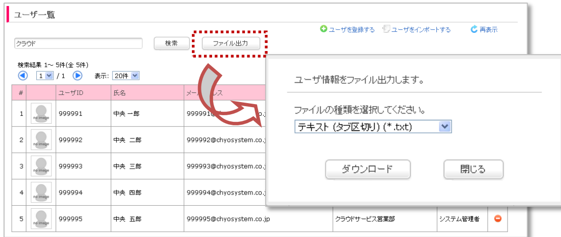
(ユーザー一覧 ファイル出力)

ユーザ情報を TEXT 形式または CSV 形式のファイルに出力できるようになりました。