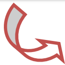
(送信予約メール一覧)