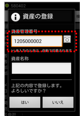
読み取った内容が資産管理番号に 入力されます

これにより、現物に貼り付けた資産管理ラベルを読み取って資産を登録することで、ラベルと資産の紐付けが確実にできます。