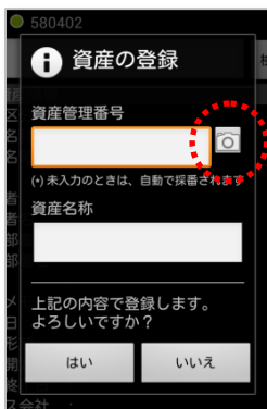
カメラアイコンをクリック