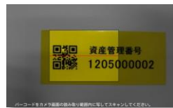
QR コードを読み取ると