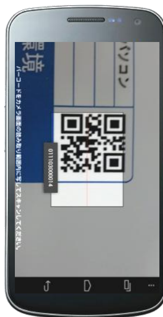
管理ラベル読取画面